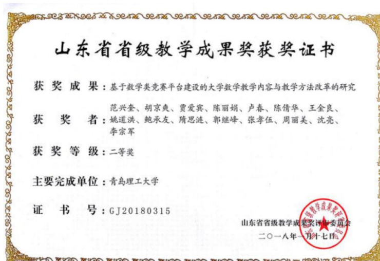
教学团队获得2018年度山东省省级教学成果二等奖

贯彻“因材施教、分类培养”教育理念，构建和实施“多层次、递进式”实践教育体系，深度融合我校土木、机械、信息、经济等学科的专业优势，建成科学与工程计算、信息技术、金融数学三个特色发展方向，形成了“厚基础、宽口径、强实践、重创新”地方院校数学与应用数学专业创新应用型人才培养模式。现拥有全国优秀教师1人、全国宝钢奖优秀教师2人、省教学名师1人、青岛市教学名师2人、省突出贡献中青年专家1人、泰山学者青年专家1人、省教学成果奖获得者3人（第一完成人）。